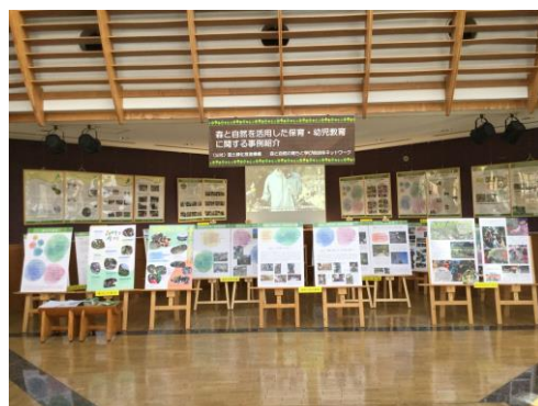
2019年度のパネル展示の様子